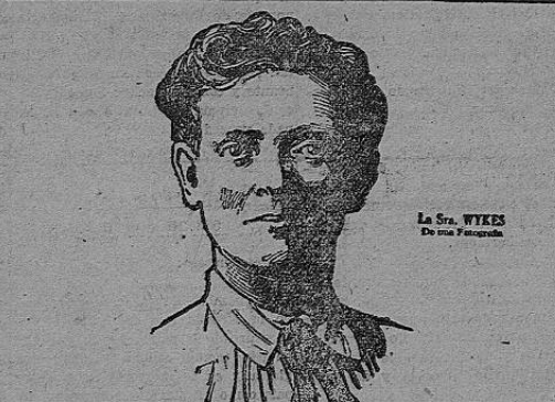
La Sra. WIKES de una familia.

Ecos de la prensa extranjera INCIDENTE DE LA GOYA La prensa española que se edita en Méjico nos trae la noticia de que la gloriosa tonadillera la Goya, que estuvo en nuestra capital, tuvo un serio y extraño incidente con la empresa respectiva por razones de suspensión del programa anunciado. La Goya había conquistado simpatías profundas en el público mejicano por su arte exquisito. Según dice "El Día Español", la artista se sintió muy delicada una noche, y no fue al teatro a cumplir con su compromiso. Pató el público hasta desesperarse. Sudó de lindo el empresario trabajó no menos la telefonista de la Central, juró y rejuró la Goya, y por fin vino la intervención de la policía. Como era de esperarse, dados los encantos de la niña, la Goya triunfó y rompió el contrato. Pero el empresario que no por capricho dejó de sentirse herido, ha metido en un lío a la niña Goya y a estas horas ella no puede salir de Méjico sin ceder un afianza de 30 mil pesos! ¡Aprieta... y baila, para pagar, por